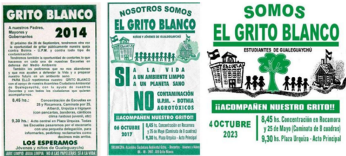
Figura 3 Convocatorias al Grito Blanco

La figura 3 reúne tres convocatorias al Grito Blanco expresadas en volantes de mano y digitales, de los años 2014, 2017 y 2023. Al analizar estos volantes, se evidencia una continuidad estética y una clara jerarquía gráfica en la representación de las principales consignas. Pero también es posible ver que la ACAG, como institución que promueve e invita, se desplaza de la convocatoria y cede el protagonismo en la actividad a los “niños y jóvenes de Gualeguaychú” y “estudiantes de Gualeguaychú”.