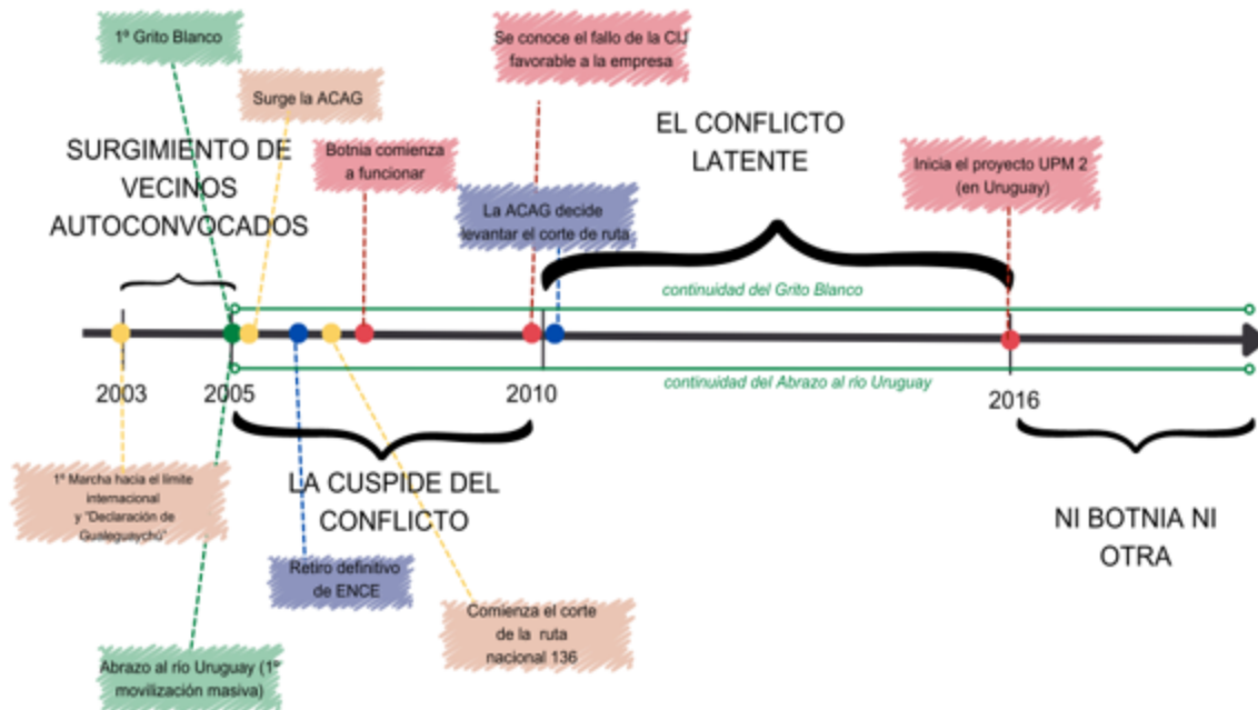
Figura 2 Etapas y eventos principales del conflicto ambiental en Gualaguaychú

La figura 2 representa gráficamente las etapas del conflicto centradas en la acción colectiva y eventos salientes de las dos décadas de disputa.