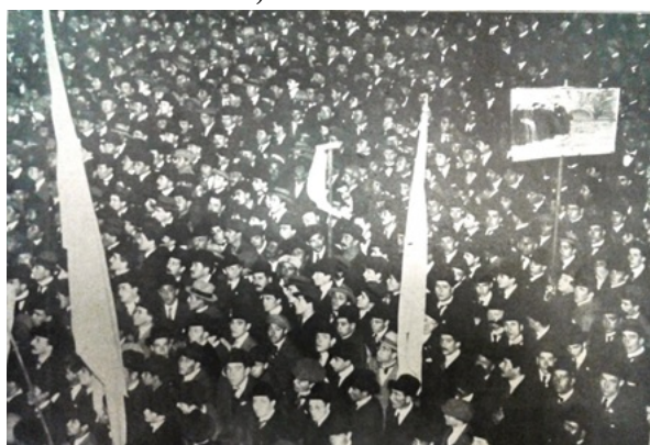
(Atlántida, 4 de julio de 1918)

En la fotografía se ve a estudiantes llevando pancartas que representaban a sacerdotes oscurantistas huyendo de un sol naciente, mezclados con rostros que pertenecen claramente a trabajadores. La FOL había apoyado la huelga universitaria, pero además desde el 1° de mayo estaban en huelga los obreros molineros de todo el país, incluyendo los cordobeses, con la adhesión de otros gremios. El conflicto de los molineros sólo se